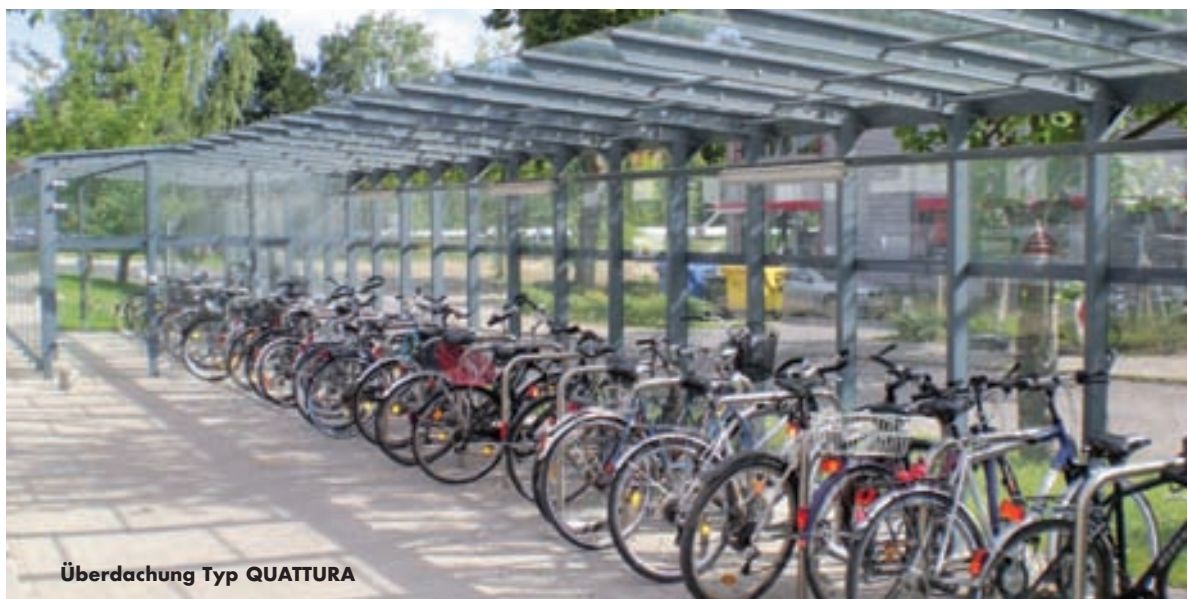
Überdachung Typ QUATTURA