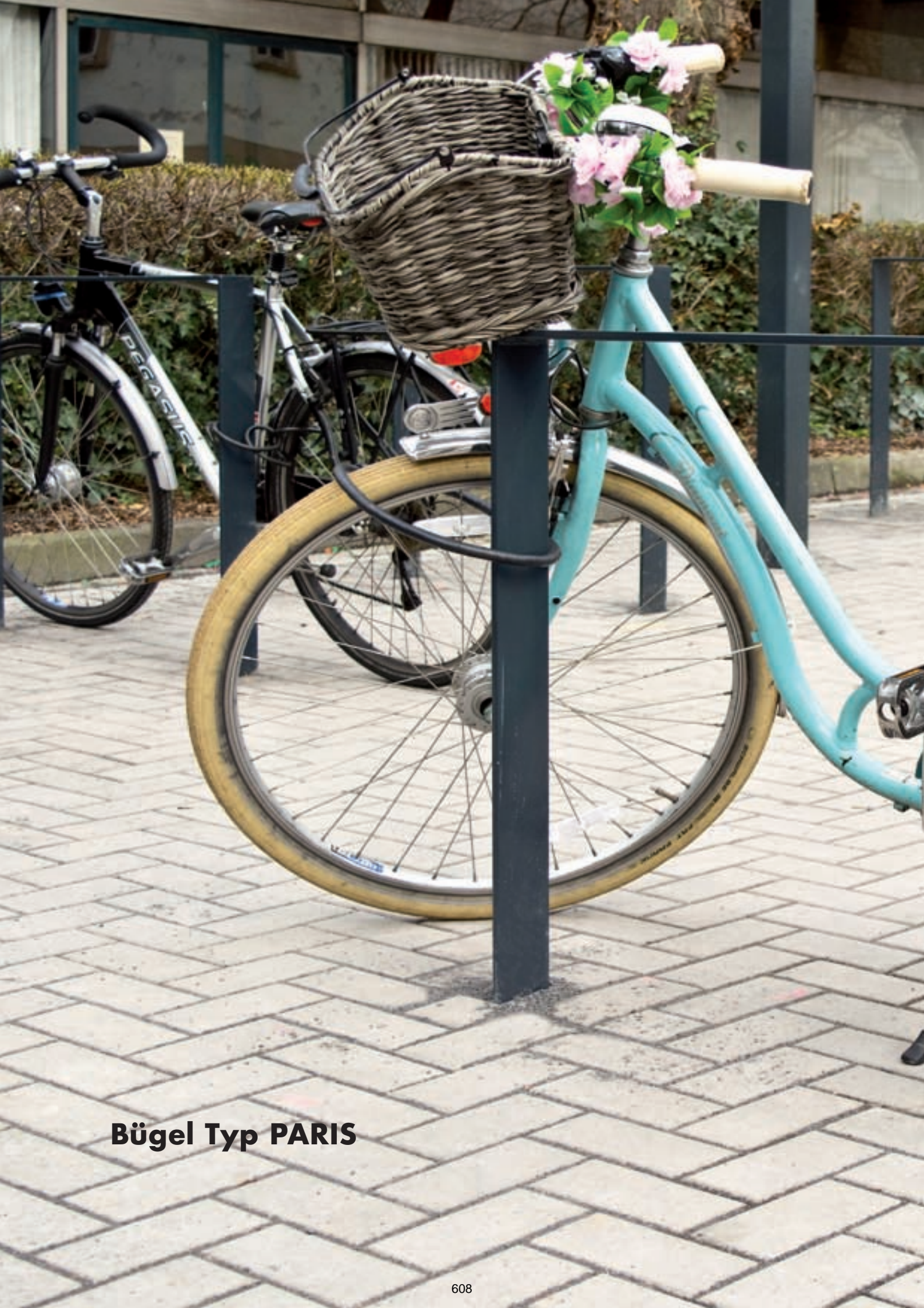
Bügel Typ PARIS