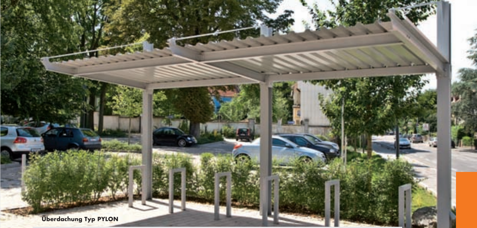
Überdachung Typ PYLON