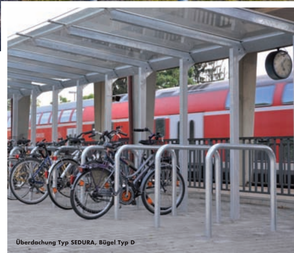
Überdachung Typ SEDURA, Bügel Typ D