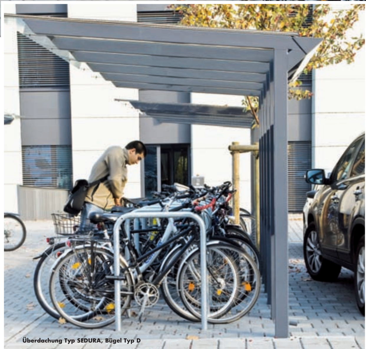
Überdachung Typ SEDURA, Bügel Typ D