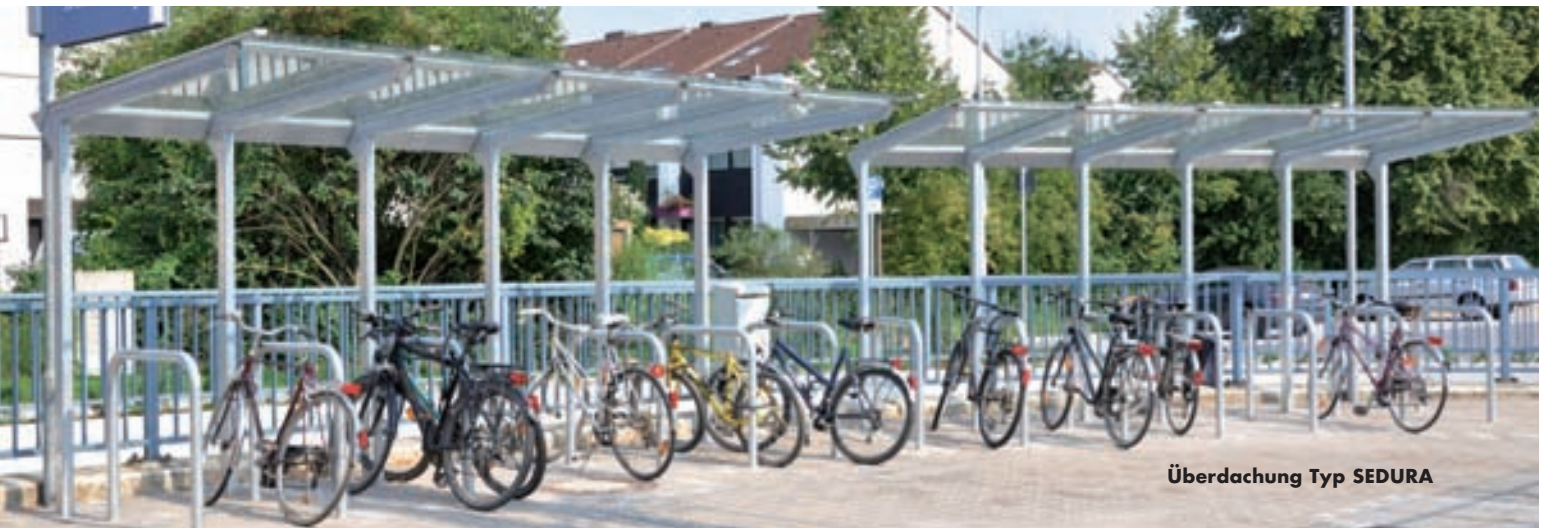
Überdachung Typ SEDURA