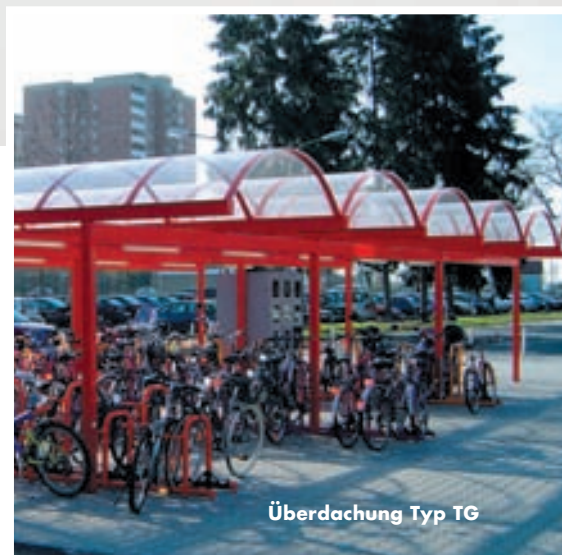
Überdachung Typ TG