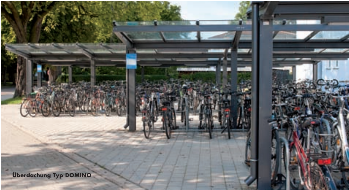
Überdachung Typ DOMINO