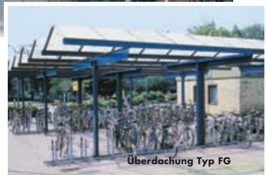
Überdachung Typ FG

Zur anwendungsoptimierten Produktspezifikation siehe Schritte A, B, C , auf Seite 488 und 489.