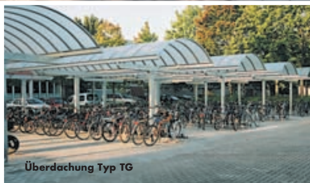
Überdachung Typ TG