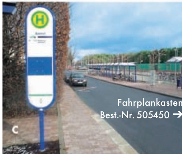
Fahrplankasten Best.-Nr. 505450 →